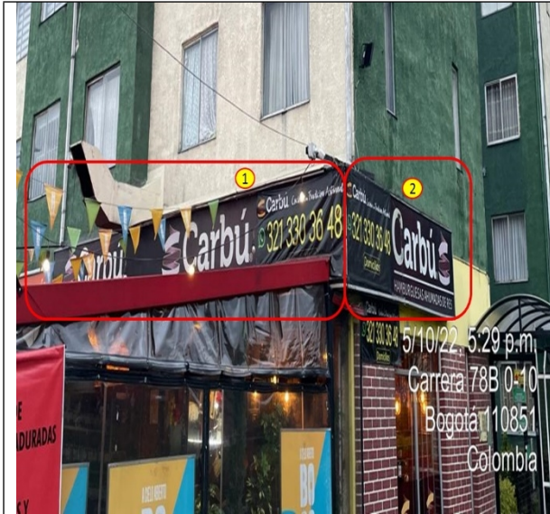
Elemento de publicidad tipo aviso en fachada, el cual no cuenta con registro de publicidad exterior visual de la SDA.