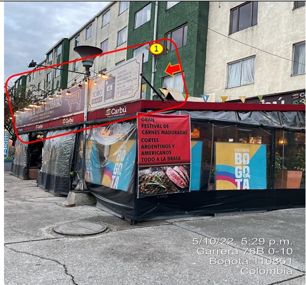
Elemento de PEV, el cual se encuentra volado de la fachada del establecimiento de comercio.