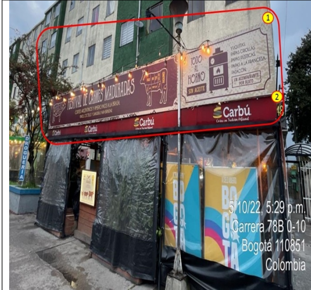
Elementos de PEV del establecimiento comercial, adicionales al aviso único permitido, los cuales se encuentran ubicados en la fachada.